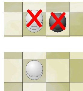
Ejemplo de sacrificio