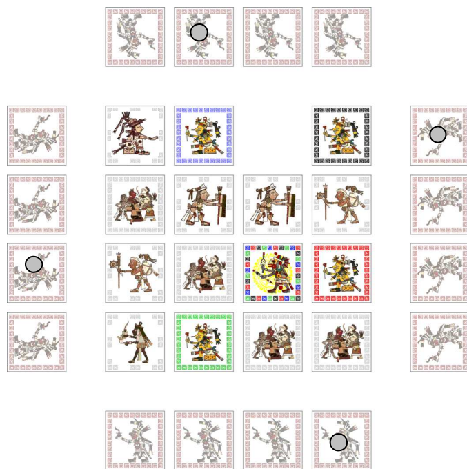
Ejemplo de preparación de partida

Coloca todas las fichas de mercancía en la bolsa del juego, también denominada reserva de mercancías . Sin mirar, retira de la reserva 4 mercancías. Si quieres partidas más cortas, retira más mercancías (siempre un múltiplo de 4). Si no quieres azar, retira el mismo número de mercancías de cada color o no retires ninguna mercancía.